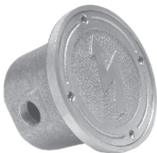
Caixa de Passagem

Acessório indispensável para a instalação dos refletores. Conectado aos eletrodutos de passagem dos cabos elétricos ele possibilita a junção do cabo do refletor aos fios provindos do transformador evitando umidade e permitindo acesso, quando necessário algum tipo de reparo.